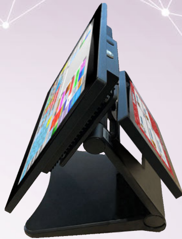
Configuration avec écran client 7"