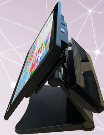
Configuration avec afficheur client 2 lignes