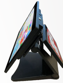
Configuration avec écran client 7"