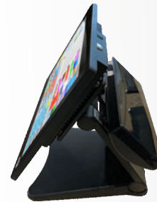
Configuration avec afficheur client 2 lignes